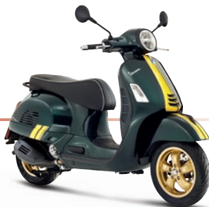
Grün Racing Sixties VY