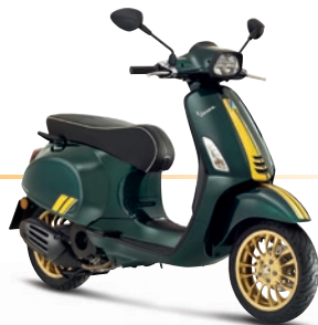
Grün Racing Sixties VY