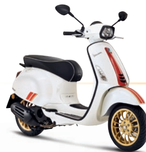
Weiß Racing Sixties BR