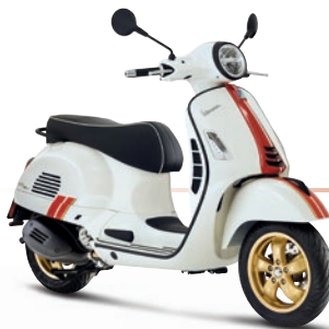
Weiß Racing Sixties BR