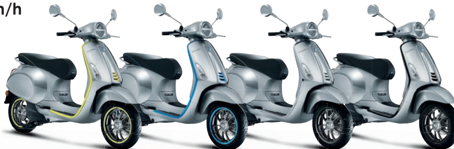
Grau HV (719/C)