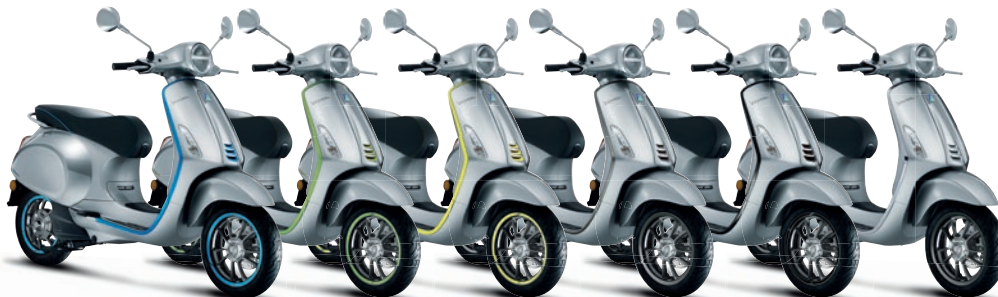
Grau HV (719/C)