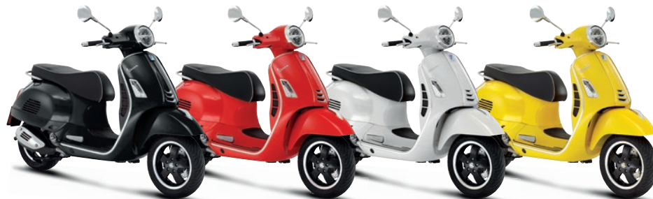
Schwarz Lucido 90 (94)