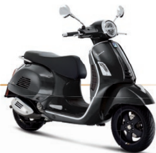
Schwarz Vulcano XN2 (98/A)