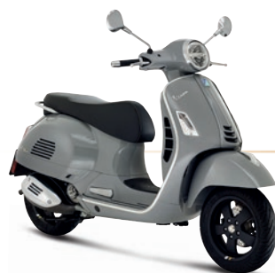
Grau Materia HT (715/C)