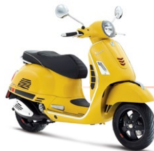
Gelb Gelosia 974/A