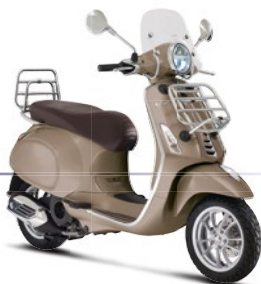
Braun Creta Senese 129/A