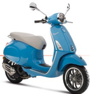
Blau 50° 291/A (Abbildung: 125 ccm-Version)