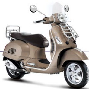
Braun Creta Senese 129/A