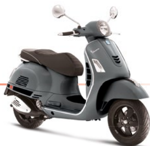
Grau Titanio 707/C