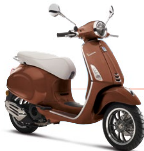
Braun matt 50° 139/A (Abbildung: 125 ccm-Version)

Ab Mai 2018 3.690,00 € inkl. 150,00 € Nebenkosten