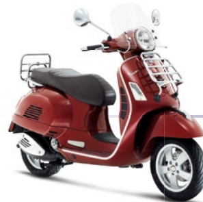
Rot Vignola 880/A