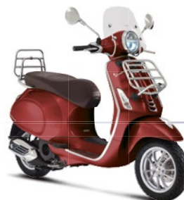
Rot Vignola 880/A