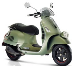
Grün matt 344/A